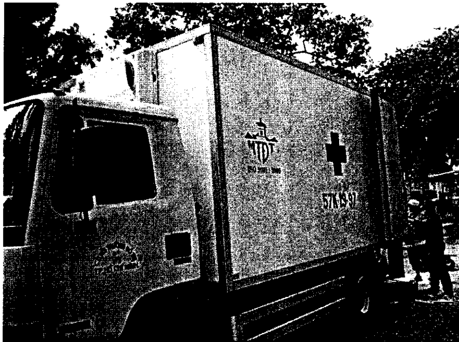
Hình 2 : xe thu gom, vận chuyển CTRYT của Công ty TNHH MTV Môi trường đô thị thành phố.