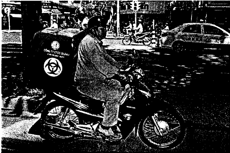
Hình 1 : xe thu gom, vận chuyển CTRYT bằng xe mô tô của các Công ty TNHH MTV DVC các quận, huyện.

Hình ảnh phương tiện thu gom CTRYT trên địa bàn Tp.HCM. (Kèm theo công văn số: ...../UBND - ngày tháng năm 2014)